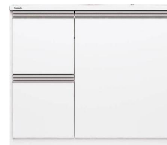
引き出しプラス開き戸 幅750mm