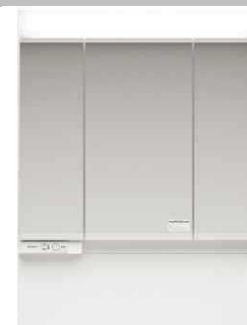
3面鏡 蛍光灯 ミドルミラー無し