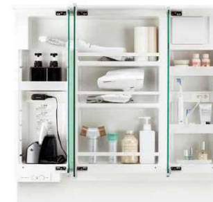
3面鏡の内側にコンセントがあるので、 大き目の家電も充電しながら収納可能です。